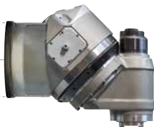
45° Fräskopf Testa a 45°