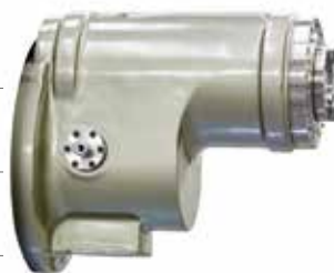
Gerader Vorsatzkopf Testa con uscita diretta