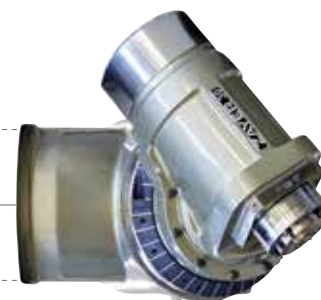
30° Fräskopf mit Motorspindel Testa a 30° con elettromandrino