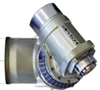
Cabezal 30° con electromandrino 30° head with electrospindle