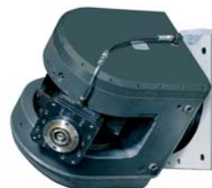
TWIST con electromandrino

Central Pol. Ind. Betoño Portal de Bergara, 7 01013 VITORIA-GASTEIZ España Tel.: +34 945 26 28 00 Fax: +34 945 28 66 47 zayer@zayer.es