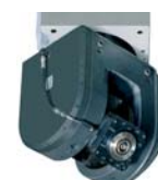
TWIST con electromandrinó

Central Pol. Ind. Betoño Portal de Bergara, 7 01013 VITORIA-GASTEIZ España Tel.: +34 945 26 28 00 Fax: +34 945 28 66 47 zayer@zayer.es