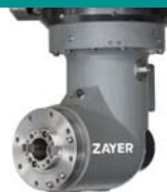
Cabezal en "L"